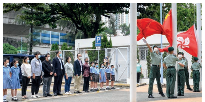
2021年9月26日第二關國慶亮劍升旗禮

疫情下我與許多武術同仁和學生依然保持著密切的交流，大家在如此艱難情況下，仍然不忘初心，堅持訓練，維持強健的體魄。在過去幾輪比賽裡，各路武術同仁使出渾身解數，激發自身潛能，為闖關賽增添了不少精彩瞬間。《商君書·戰法》中提到：「王者之兵，勝而不驕，敗而不怨。」比賽和演出一樣，雖然只是