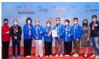
尚武崇道獎由余澤倫太極拳藝社美孚隊獲得