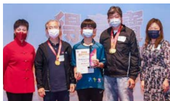
時代風尚獎由基金會雙節棍隊伍代表領獎