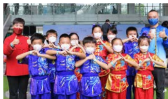
神采魅力獎由香港國際武術文化中心獲得